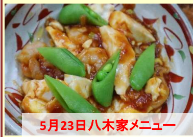
5月23日八木家メニュー

ふたをして弱めの中火で約5分煮る。⑤豆腐が温まったら、ねぎとごま油大2を加え、卵を回し入れて大きく混ぜ、半熟になったら火を止める。