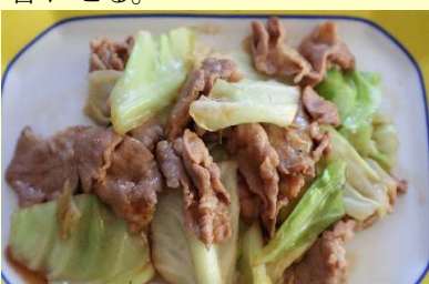
1月4日八木家メニュー

①キャベツと豚肉は食べやすい大きさに切り、豚肉にしょうゆと酒をもみ込む。②フライパンにごま油を熱して豚肉を炒め、色が変わったらキャベツを炒め合わせる。